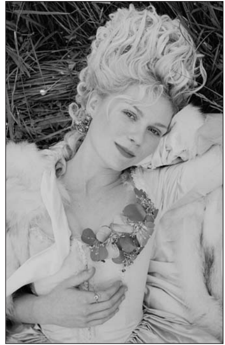
The effect that costumes, makeup, and hairstyles can have in creating characters for motion pictures is illustrated best by examining the varied “looks” individual actors have assumed throughout their careers. Kirsten Dunst is seen as she appeared as Judy Shepherd in JUMANJI (1995), as Amber Atkins in DROP DEAD GORGEOUS (1999), and as the title character in MARIE ANTOINETTE (2006).

M any different elements influence costume design, including the time and place in which the story is set, the relationships between the different characters, and the wishes of the director. Even when purchasing clothes for characters in contemporary films, the costume designer chooses each piece to be absolutely right for each character.